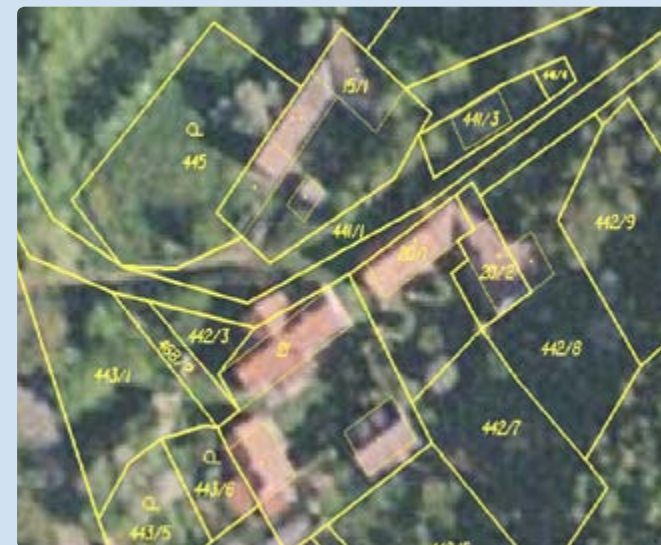
Ortofoto s obrazem katastrální mapy

Údaje o hranicích pozemků je možné zpřesnit dvěma způsoby. Pokud vlastníci mají označeny nesporné hranice pozemků v terénu (zdmi, ploty, hraničními znaky v lomových bodech), zeměměřič tyto hranice zaměří, a po porovnání s dosavadními méně přesnými údaji vyhotoví geometrický plán.